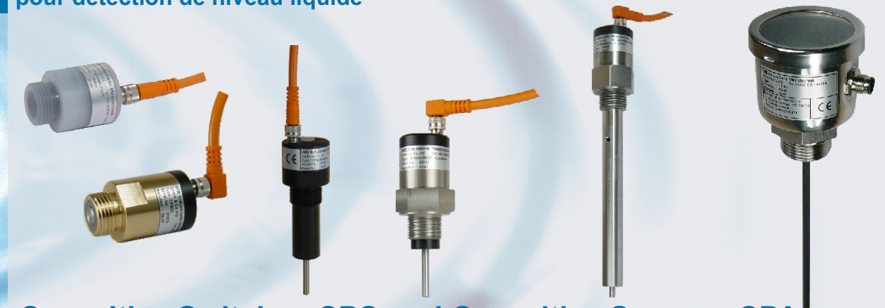
Capacitive Switches CPS and Capacitive Sensors CPA for detecting the level of liquid media