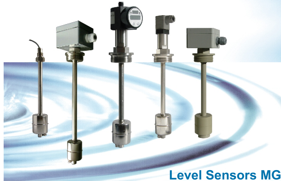
Level Sensors MG Output: 4-20mA or resistance signal

sortie analogique 4-20 mA ou potentiométrique