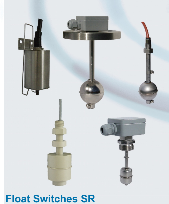
Float Switches SR