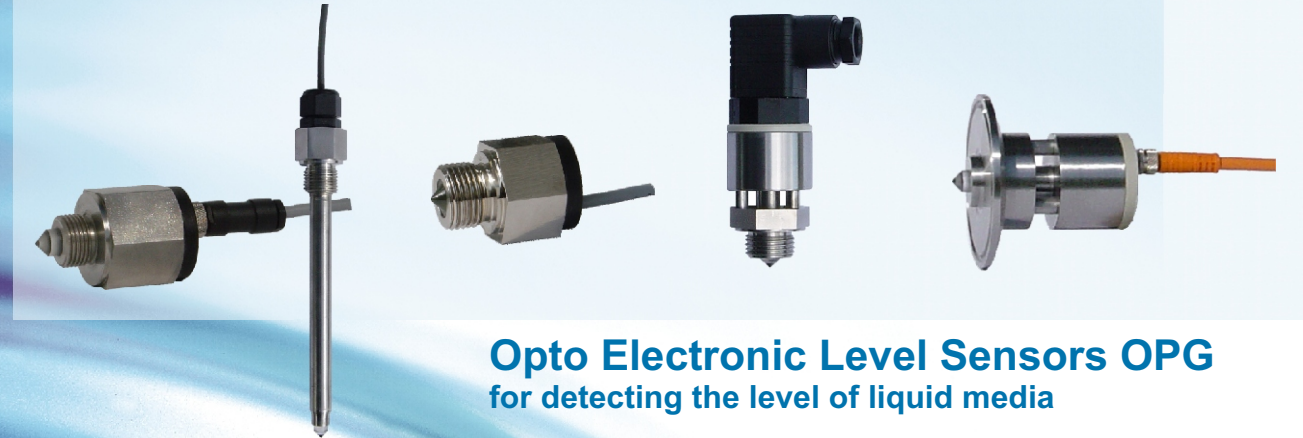
Opto Electronic Level Sensors OPG for detecting the level of liquid media